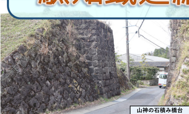
山神の石積み橋台